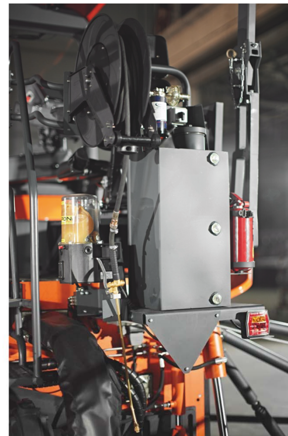
Система промывки с баком 32 л