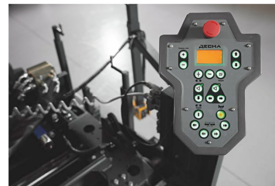
Унифицированный пульт выносной