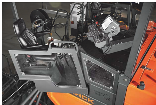
Новое поворотное место