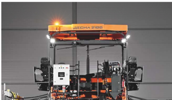
Система освещения А360+