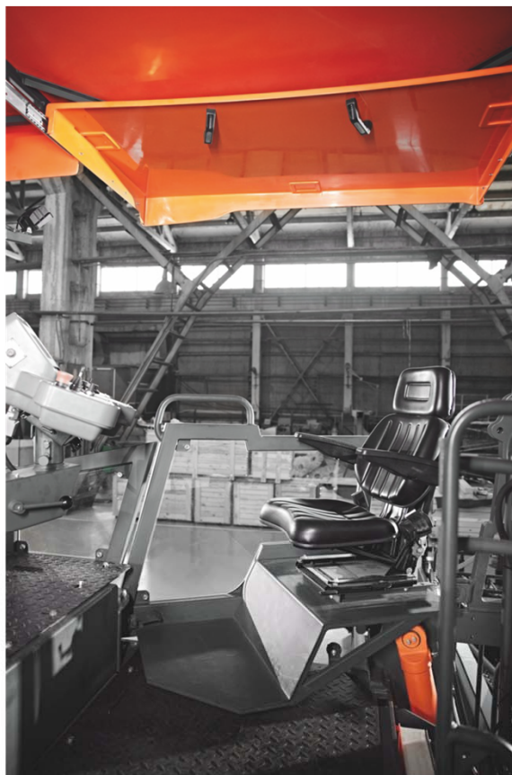
Увеличенная рабочая зона