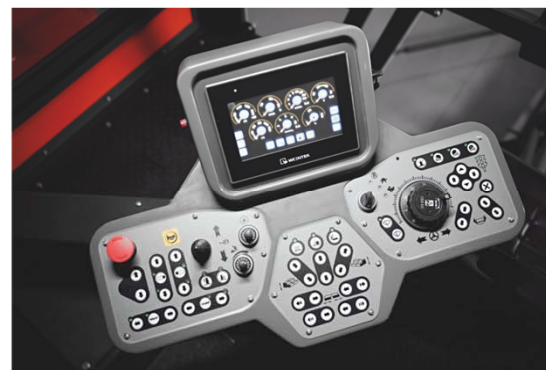
Унифицированный пульт основной